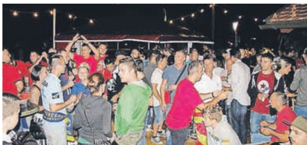
V Ejga so se družili navijači vseh reprezentanc, Črnogorci, Bosanci, Srbi, Makedonci, Litovci ...

Prav za prvenstvo so v Ejga v ponudbo dodali čevapčiče, ki so jih preizkušali več mesecev, da so bili zadovoljni z okusom. Ker so se tako odlično prijeli, jih bodo zdaj imeli v stalni ponudbi pod imenom Čevapčiči EuroBasket 2013.