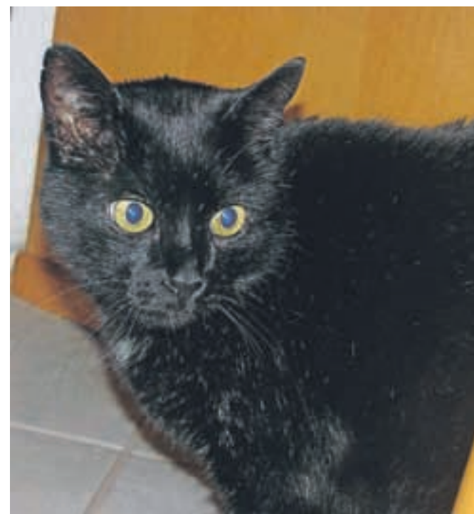
Maček Marunko je bil v jašku kanalizacije, kamor so ga delavci pomotoma zasuli. Zdaj je že doma, živ in zdrav.

sporočilo z veselo vsebino: Marunka so našli živega in zdravega. "Z veseljem sporočam, da smo našega firbčnega kosmatinca našli v jašku kanalizacije, ki jo trenutno delajo v naši ulici. Po nesreči so ga delavci zasuli, danes pa je brat slišal mijavkanje in ga odkopal. Najlepše se vam zahvaljujem za pomoč in upam, da se čim več podobnih zgodb konča tako srečno, kot se je naša," je zapisala srečna lastnica Deja.