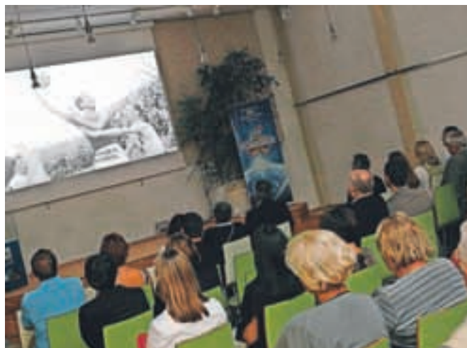
V iskriem, duhovitem, humorja polnem dokumentarcu nastopa skoraj petdeset ljudi, ki so bili tako ali drugače vpeti v razvoj jugoslovanske košarke.

V času evropskega prvenstva na Jesenicah je v Kolpernu potekala svetovna predpremiéra dokumentarnega filma Bili smo svetovni prvaki, ki je nastal v produkcijski hiši Intermedia Network iz Beograda. Premiera bo sicer nočoj v ljubljanski dvorani Union. V iskriem, duhovitem, humorja polnem dokumentarcu nastopa skoraj petdeset ljudi, ki so bili tako ali drugače vpeti v razvoj jugoslovanske košarke do osvojitve zgodovinske zmage - prve zlate medalje jugoslovanske reprezentance na