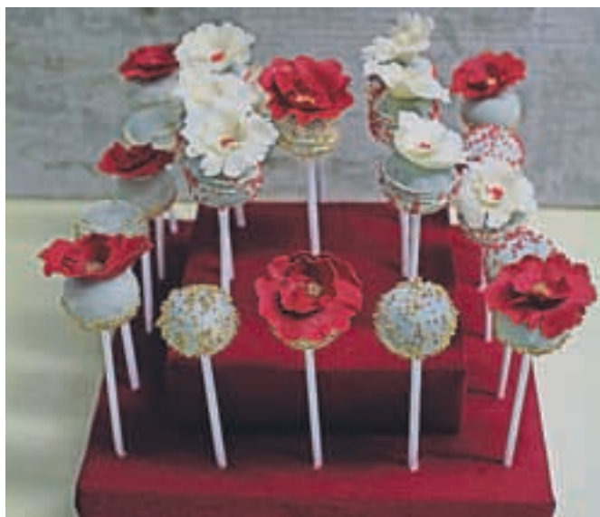
P-Pops – sladice na palčki