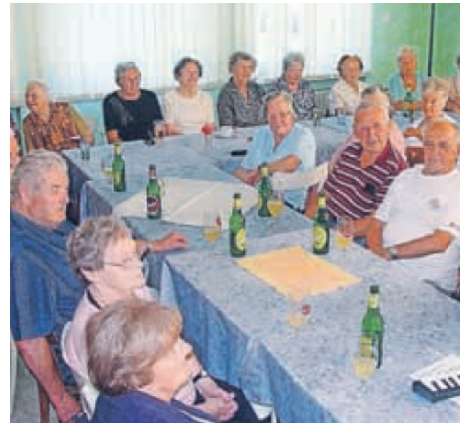
V sklopu praznovanja krajevnega praznika vsako leto pripravijo tudi srečanje s starejšimi krajanji.