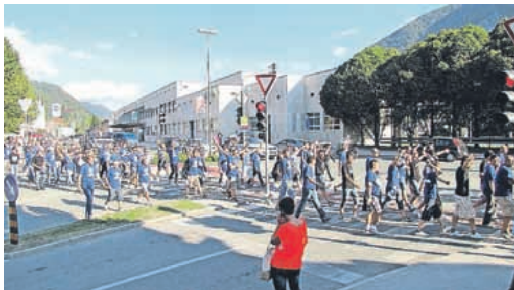
Navijaški sprevod skozi mesto / FOTO: ARHIV EJGA

Ko se je dvorana Podmežakla pojavila v krogu dvoran, ki bi gostile eno od predtekmovalnih skupin na košarkarskem Evropskem prvenstvu, so se oglasili številni skeptiki. Stara podoba dvorane nikakor ni zadostovala potrebam za tako veliko tekmovanje. Z adaptacijo so se stvari začele premikati v pozitivno smer. »Grdi raček« je postajal preteklost, »labod« pa je v vsem sijaju pričakal šest reprezentanc. Žreb se je pozitivno poigral z jeseniško skupino. Kroglice v Postojnski jami so v zgornjesavsko dolino postavile štiri države iz bivše Jugoslavije (Bosna in Hercegovina, Srbija, Črna gora, Makedonija) in dve državi iz bivše Sovjetske zveze (Latvija, Litva). Če gledamo primerjavo med Jesenicami, Ljubljano, Celjem in Koprno, so bile jeseniške tekme najbolj obiskane. Skupno si je 15 tekem v Podmežakli ogledalo 50.846 gledalcev, kar je povprečno skoraj 3400 gledalcev na tekmo. Rekordni obisk, 5500 gledalcev, je bilo na tekmi med Makedonijo in Srbijo. Najnižji obisk, 1600 gledalcev, je bilo na tekmi med Črno goro in Latvijo. Največ navijačev je bilo iz Makedonije in Litve. Nekaj manj je bilo Srbov, Črnogorcev in državljanov Bosne in Hercegovine. Najmanj, pričakovano, je bilo Latvijcev. Skupina je bila izredno izenačena in pred zadnjim tekmovalnim dnevom se niti približno ni vedelo, katere tri reprezentance se selijo v Ljubljano in katere tri dokončno zapuščajo prvenstvo. Vstopnice za slovensko prestolnico so si priigrali Srbi, Litvanci in Litovci. Če bi se na to mesto