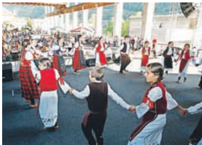
Poleg koncertov je v navijaški coni nastopala tudi folklor različnih narodnosti.