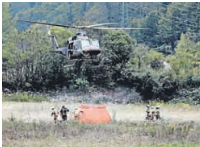
V vaji je sodeloval helikopter Slovenske vojske, ki je opremljen tudi za gašenje požarov v naravi.