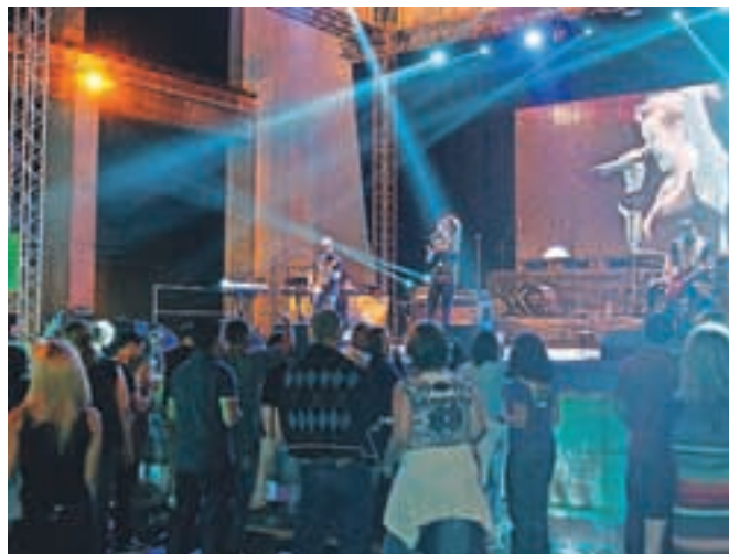
Tabu