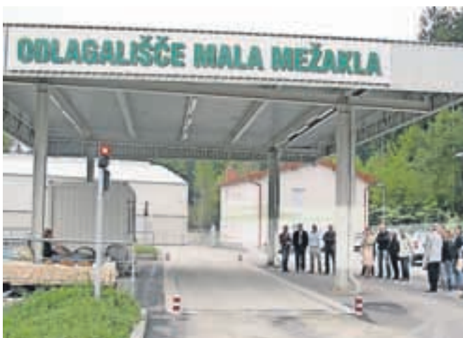
Nov vstopni plato s tehtnico, v ozadju desno nova upravna stavba, ki jo bo ogreval deponijski plin, levo pa sortirnica.

bi (sicer z veliko zamudo) začela delovati tudi sortirnica, objekt je koncesionar že zgradil, tehnologija pa je naročena, je dejal Markelj. Župani so ob tem izrazili zadovoljstvo, da je deponija Mala Mežakla urejena v skladu z vsemi zahtevami, kar je še posebej pomembno v teh časih, ko so redke občine, ki se lahko pohvalijo z lastnim deponijskim prostorom.