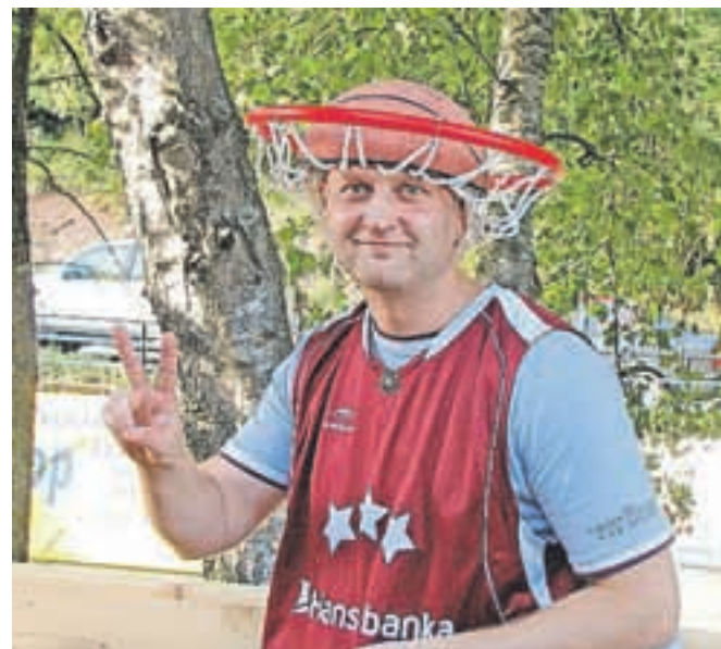
Navijač Latvije

uvrstila katera od treh držav, ki so zapustile prvenstvo, ne bi bilo popolnoma nič nezapravo. A tako pač je, enkrat se sreča nasmehne enim, enkrat drugim. V šestih dneh, en dan je minil brez tekem, v železarskem mestu, razen manjših iskric med srbskimi in bosanskimi navijači, ki jih je policija hitro zatrla, ni bilo trenj med navijači. Imeli smo nešteto primerov, ko sta skupaj sedela dva navijača nasprotnih ekip s svojimi simboli in zastavo, a daleč od tega, da bi se gledala postrani. Prostovoljci so skupaj s policisti in varnostniki naredili veliko delo in dodali velik kamenček v mozaik, da je prvenstvo potekalo po zelenih smernicah. »Delo je bilo dobro opravljeno in postorjeno je bilo vse, kar se je od nas zahtevalo. Na razpolago je bilo 180 prostovoljcev, od tega jih je bilo petnajst iz tujine. Delo, začelo se je zjutraj in je trajalo nekje do polnoči, je teklo normalno, praktično brez vsakih težav. Na Jesenicah smo imeli srečo pri žrebu, ob tem pa je bila skupina