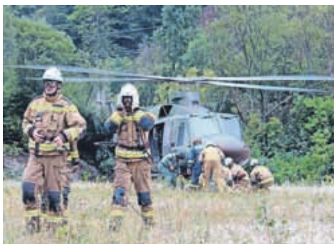
Vaja je bila namenjena seznanitvi z opremo za gašenje in njeno pravilno uporabo.

jev pri gašenju požarov v naravi, z razmerami, v katerih je sodelovanje helikopterja smiselno, seznanitev s tehničnimi značilnostmi helikopterja in opreme za gašenje ter nje pravilne uporabe.