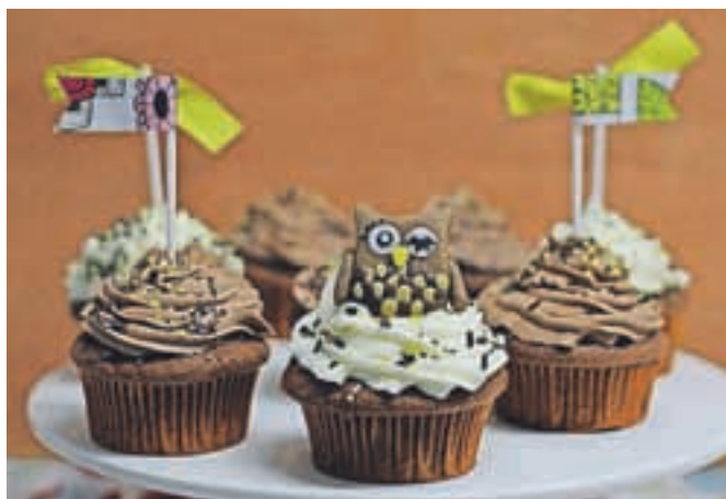
Cu-PCakes – mini tortice