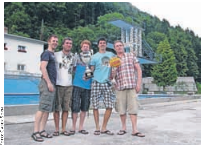
Zmagovalci zadnjih Športnih iger Jesenic ekipa Max bara

Zavod za šport Jesenice organizira že šeste Športne igre Jesenic. Zadnji zmagovalec je ekipa Max bara. Organizator je razpisal osem tekmovalj, v katerih se bodo merile ekipe in posamezniki. Razpisana so tekmovalja v kegljanju, namiznem tenisu, odbojki, košarki, badmintonu, balinanju, nogometu in plavanju na 50 metrov. Več informacij dobite na strani www.zsport-jesenice.si M. K.