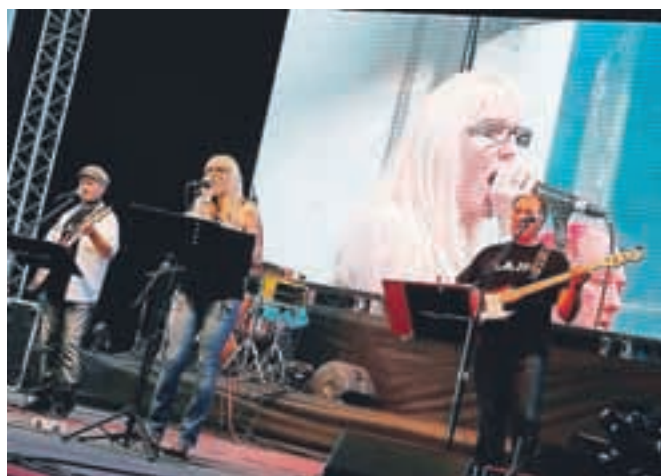
V navijaški coni sta bila kar dva velika zaslona, eden na trgu na Stari Savi, na katerem so potekali prenosi tekem, eden pa v pokriti nekdanji železarski hali, kjer so potekali koncerti.