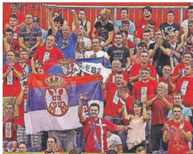
Srbija, Srbija!

V nedeljo se Evropsko prvenstvo zaključuje. Dvorana Podmežakla bo košarkarsko površino zamenjala z ledeno ploskvijo. Upamo samo, da bodo prenovljena lepota dobro obiskovali tudi hokejski navdušenci, kot so jo ob največjem letošnjem slovenskem športnem dogodku obiskovali košarkarski navdušenci.