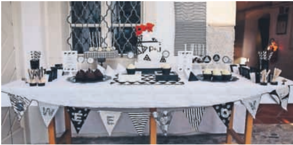
Dessert Tables, s tortami in slaščicami obložene in dekorirane mize